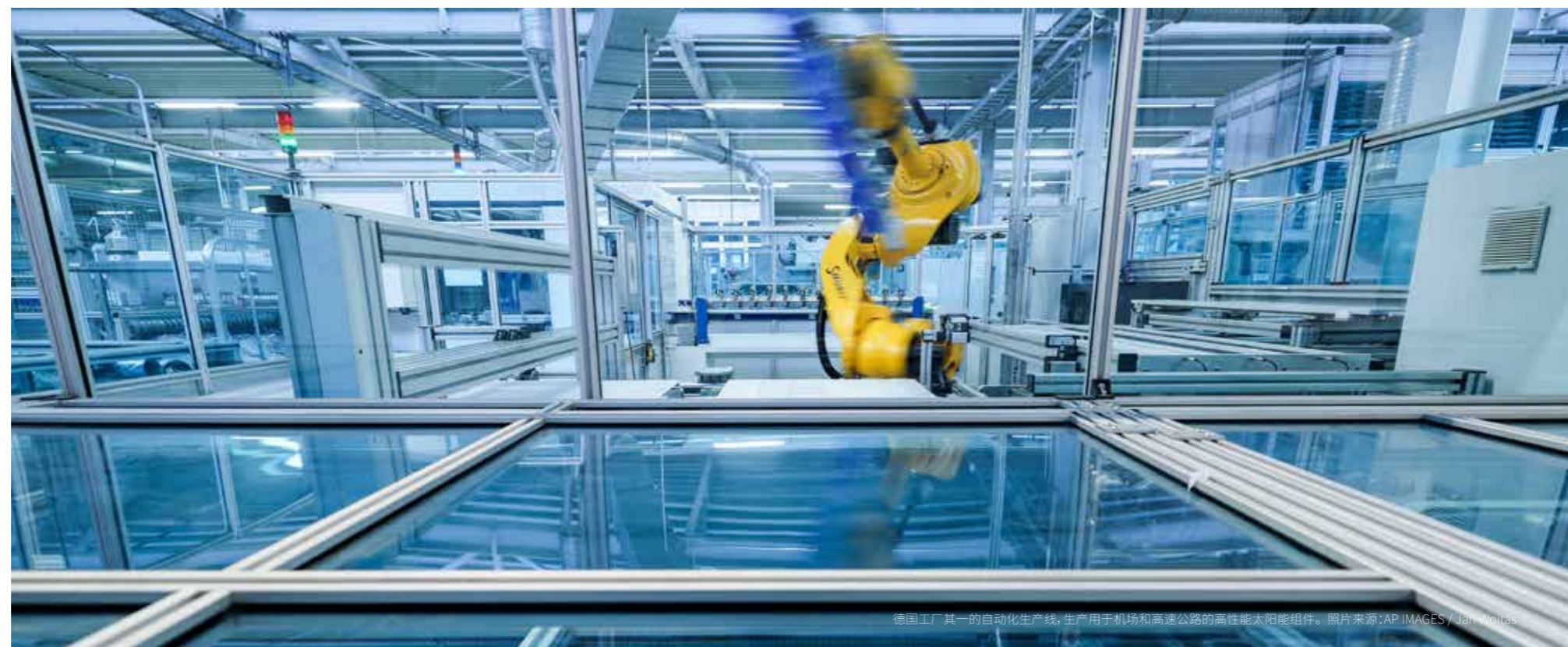
德国工厂其一的自动化生产线，生产用于机场和高速公路的高性能太阳能组件。

我们偶尔会认为，我们需要崇高伟大的创业理念，其实不然。动机不一定要复杂，简单踏实的创意也行得通。好比一项简单的手机应用程序，可以实时跟踪公共巴士以计算国家的劳动力。又或者是欢庆传统艺术家和手工艺品的国际佳节。这些企业理念代表了先进国家所具有的前瞻性，以及以价值为基础的社会。