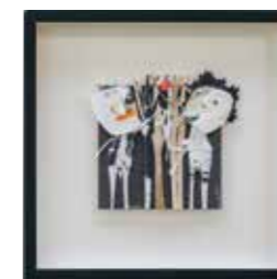
从JJ市场寻获的艺术珍品。