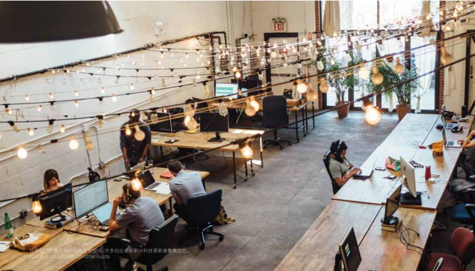
位于纽约布鲁克林的共用工作空间，许多创业者和新兴科技革新者聚集在此。