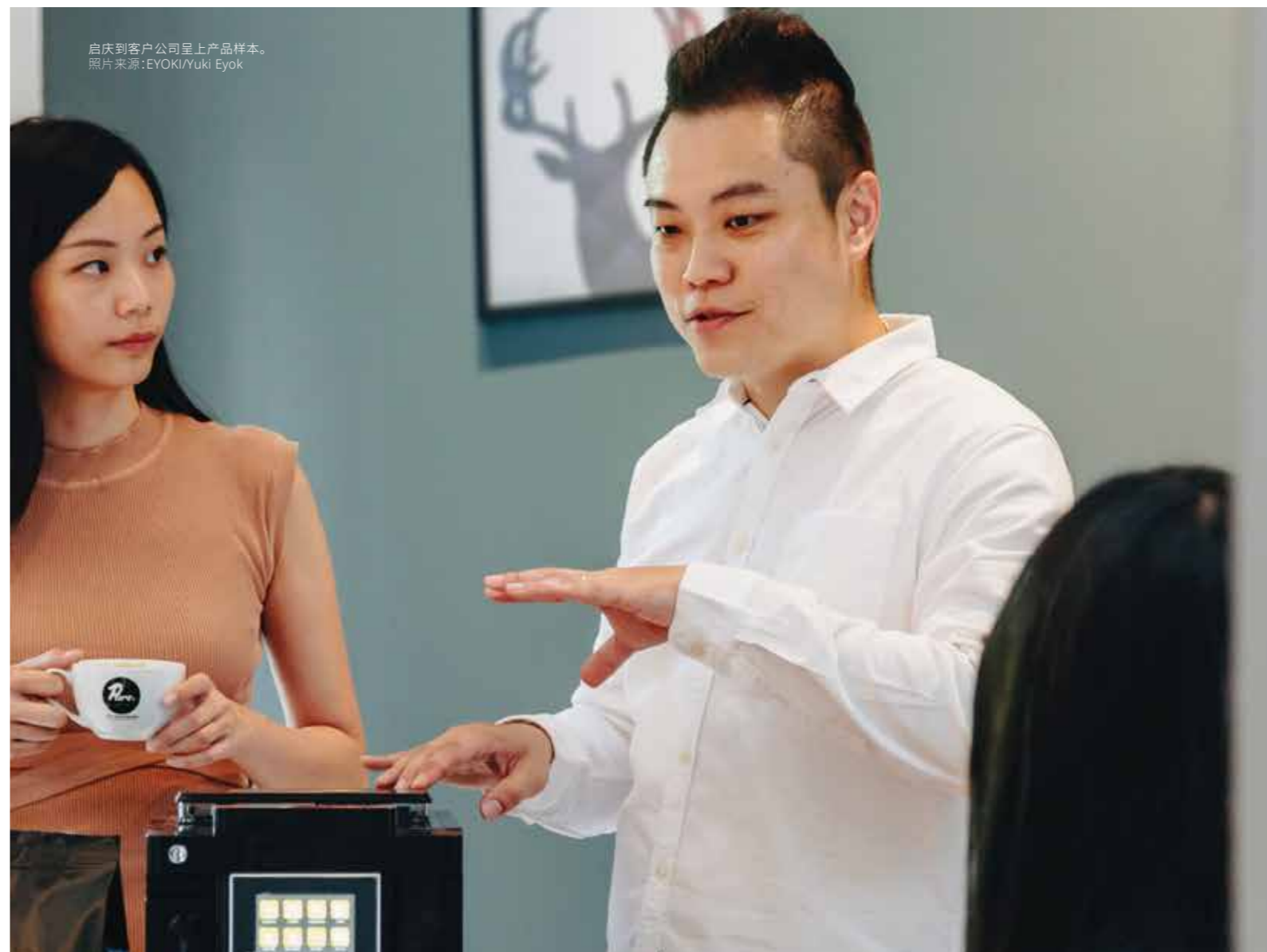
启庆到客户公司呈上产品样本。

“我想象退休的我身在意大利都灵或米兰的一家怀旧老式咖啡馆里，店面的玻璃窗上写着我的名字。”