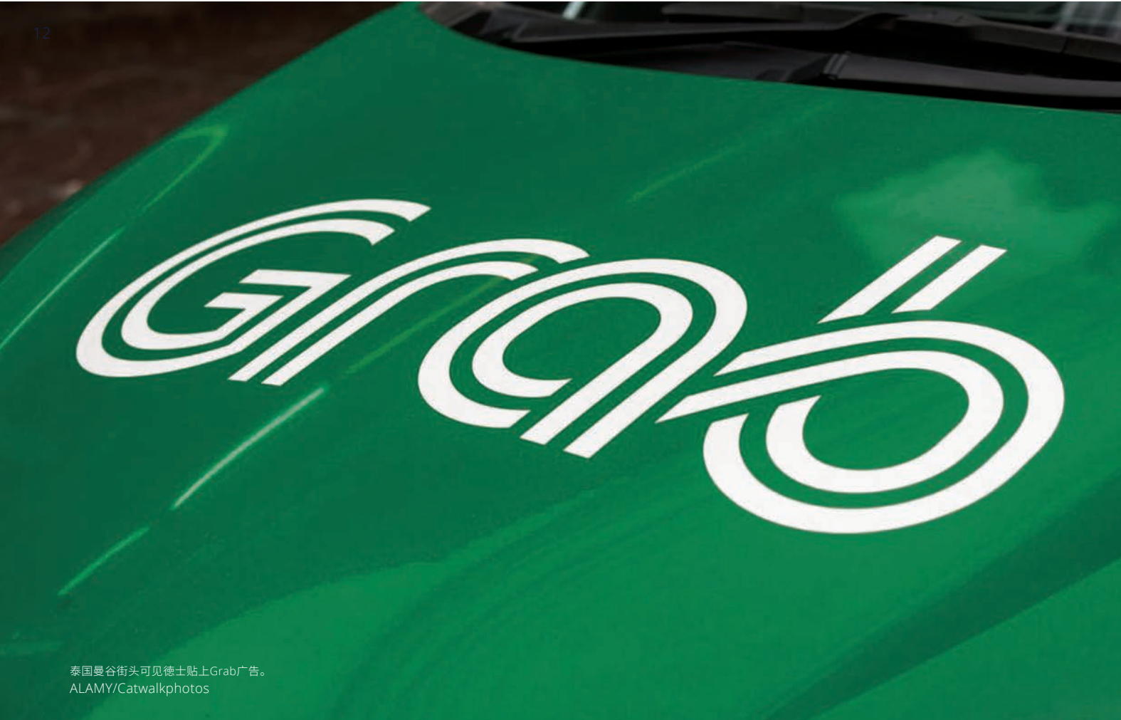
泰国曼谷街头可见巴士上Grab广告。