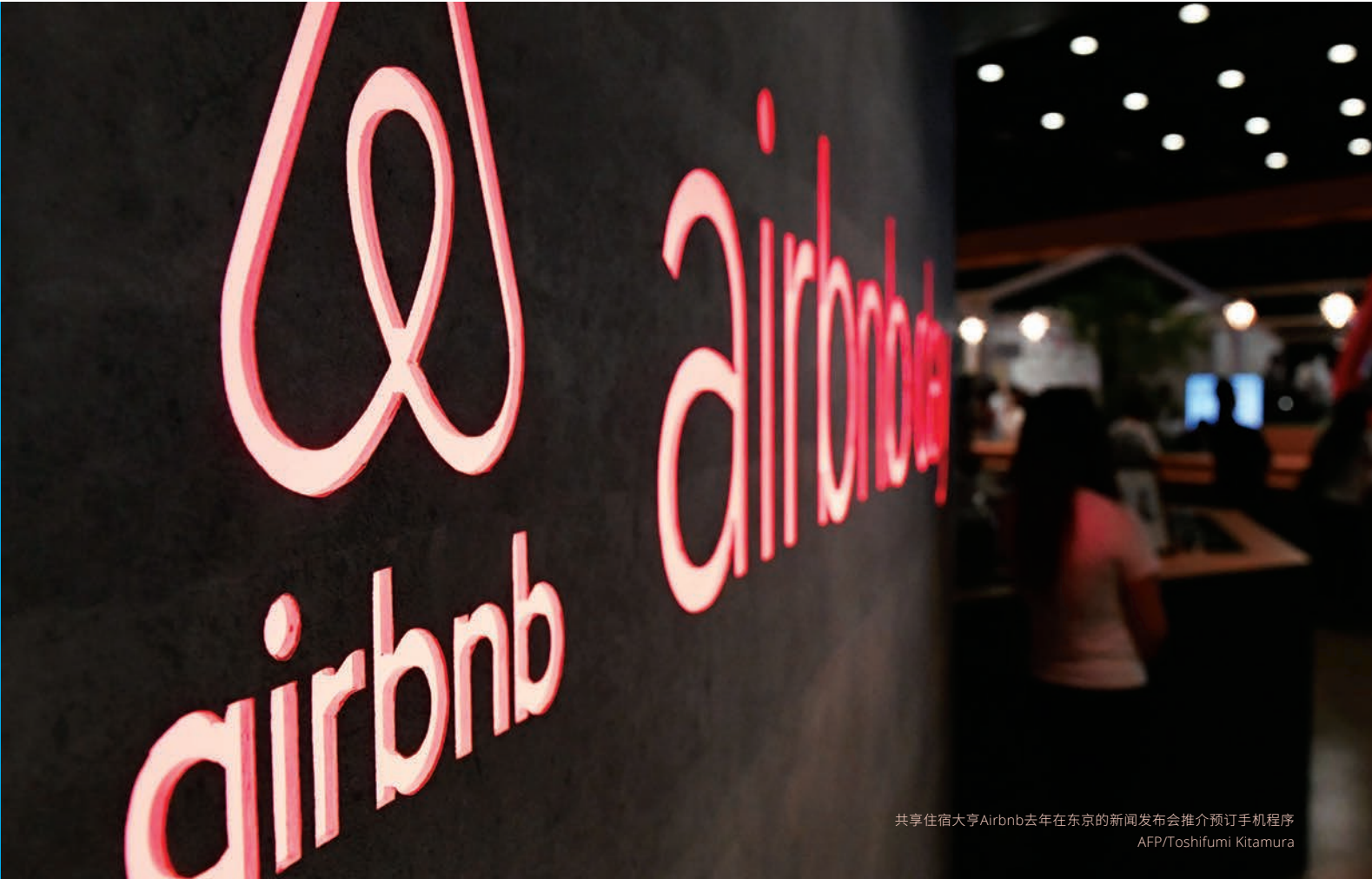
共享住宿大亨Airbnb去年在东京的新闻发布会推介预订手机程序

如果您旅行时大多数习惯携带现金,您应考虑全新的RHB Premier Multi Currency Visa转账卡作为您的通用钥匙。 1张转账卡让您享有多达13种货币的方便,您可在亚洲、美国和欧洲大多数国家以当地的货币付费,并且无需支付货币转换费用。您也可选择锁定货币汇率,避免您的资金受到外汇波动的影响。这一切都为了让减少担忧而设。