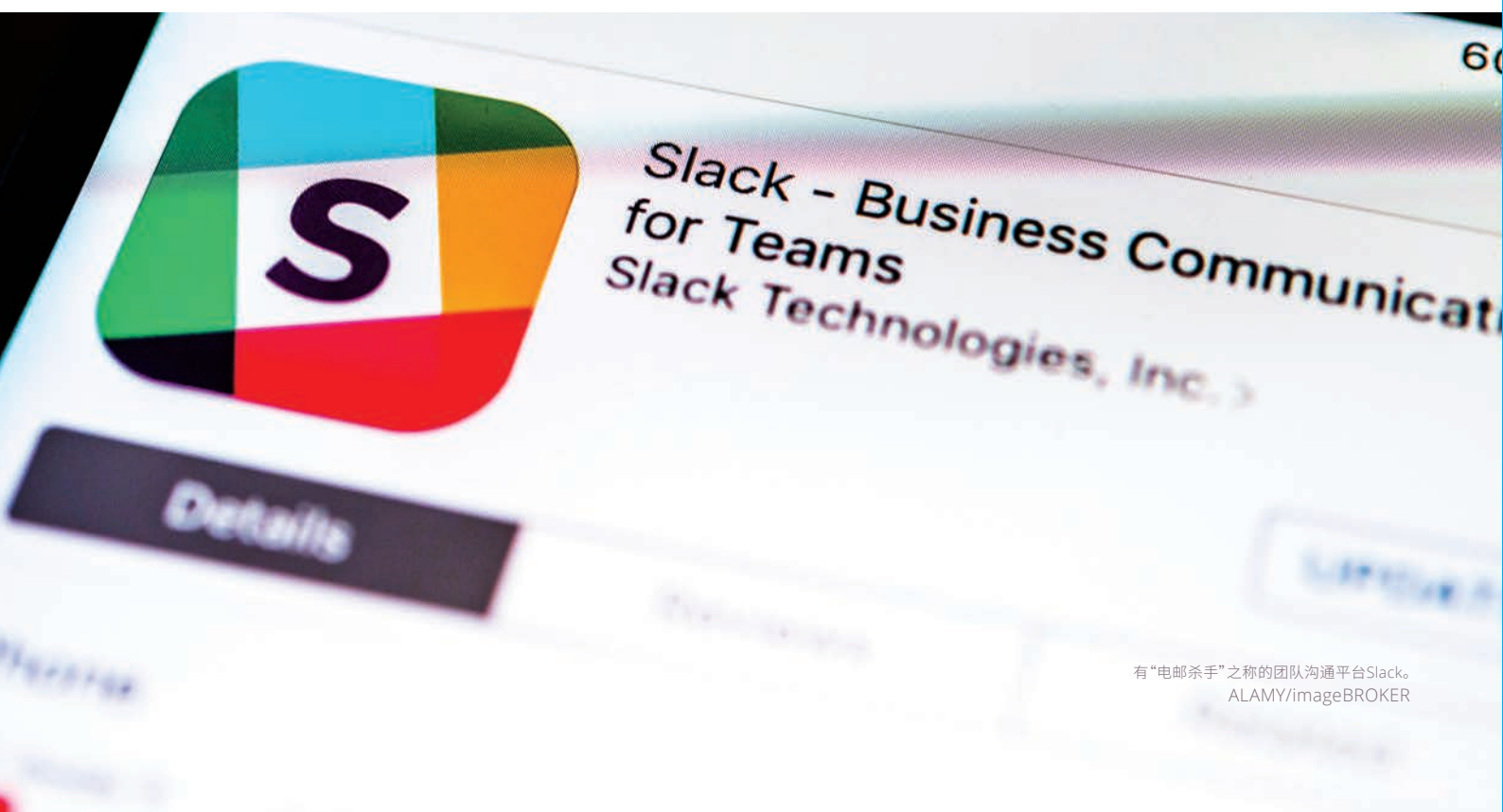
有“电邮杀手”之称的团队沟通平台Slack。

Slack的全名是Searchable Log of All Communication and Knowledge,意即您可在其中查阅所有沟通和完成的事项。 5 这个电脑程式功能大大简化了办公通讯,因此有人称它为“电邮杀手”。通过网络与团队共享虚拟办公室,不但提高工作流程透明度,同时也减少复杂的等级制度。